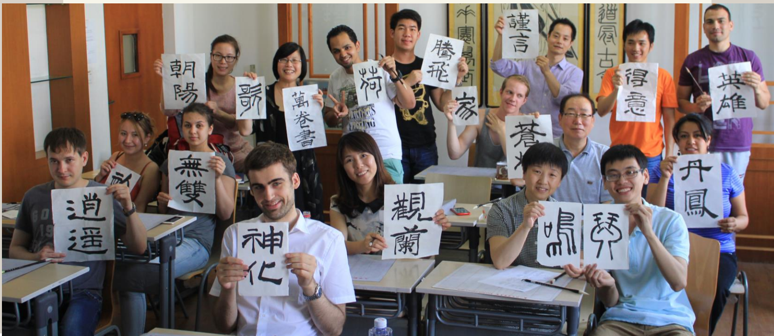
每位都习得了自己喜爱的书法字。

中国政法大学港澳台教育中心 Education Center of Hong Kong, Macau and Taiwan Students, CUPL