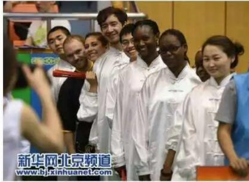
5月30日，准备比赛的留学生在赛前拍照。

渤海网新闻: www.022china.com 时间: 2015-05-31 10:38:04