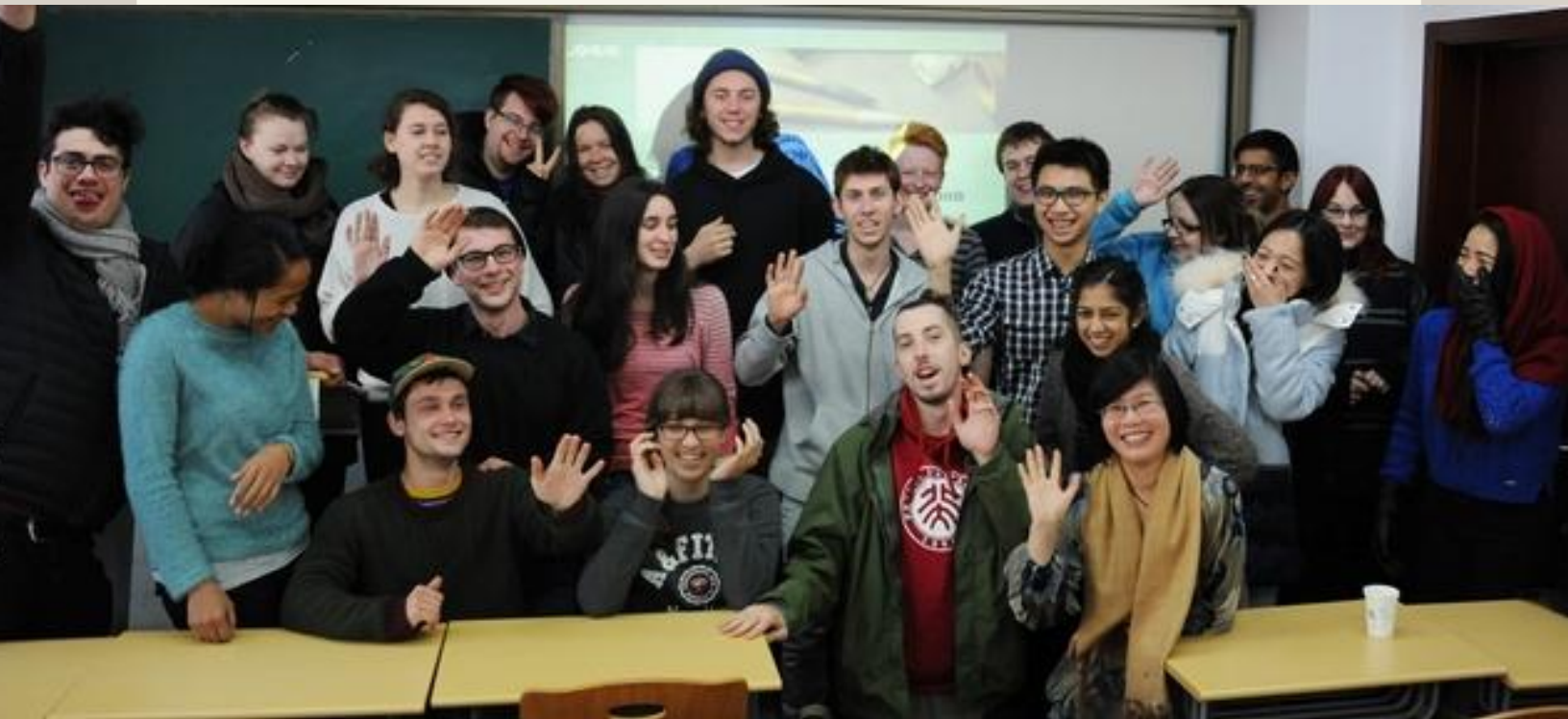
中国政法大学港澳台教育中心 Education Center of Hong Kong, Macau and Taiwan Students, CUPL