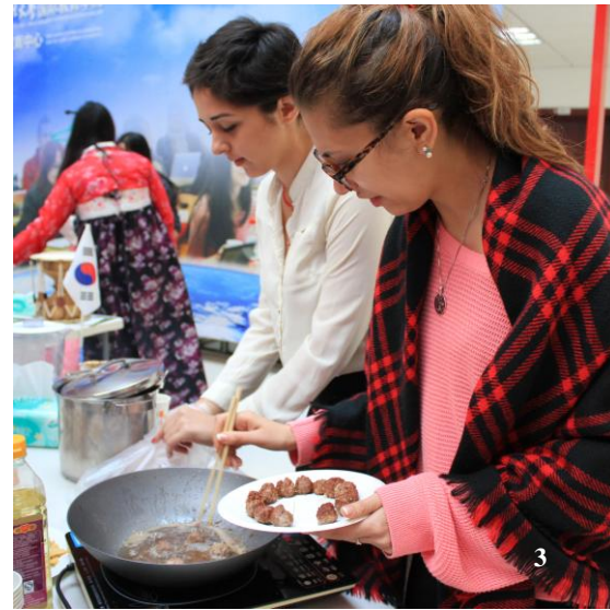
1-2, 品尝土耳其美食。 3, 现场制作肉丸子。